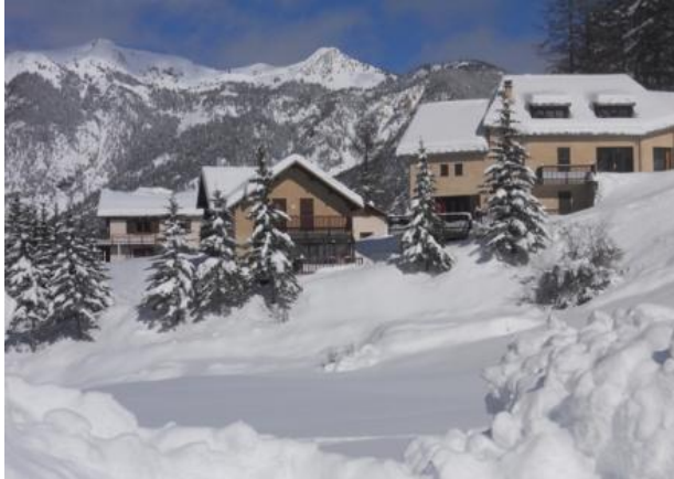
Les chalets en hiver.