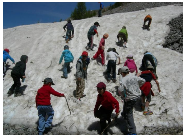
Une partie des enfants de la classe verte sur la neige.